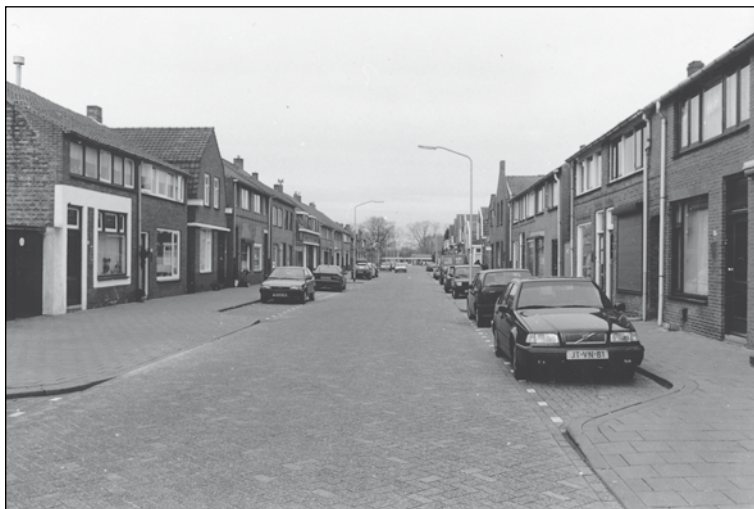
De Koningsdijk, een opname van Cor Huijben uit 1998. Foto collectie HKO.

De Eikdijk, met een eerste vermelding in 1606: Eyckdyck (R290, f142), werd boven al genoemd. Waarschijnlijk sloot deze straat in Oosterhout aan op de Bouwlingstraat en de Tilburgseweg. Deze weg moest in 1735 opgehoogd worden met de aarde die uit de sloten ernaast gegraven moest worden. De weg moest goed 'tonrond' gelegd worden, zodat het regenwater meteen naar de sloten kon lopen. In totaal werd hij 2½ voet opgehoogd, dat is ongeveer 75 cm. Men had, zoals hiervoor al vermeld werd, namelijk veel last van het water dat uit de ten oosten van de Eikdijk komende vlakke over de weg heen spoelde (OA 16, f19v en OA 1238). Dat die weg noodzakelijk verhoogd moest worden, blijkt uit klachten van de inwoners van Dorst dat zij door het overstromende water hun doden haast niet naar het kerkhof van Oosterhout konden brengen. In 1753 wordt verklaard dat de Eikdijk van alle oude tijden is geweest 'den Lykdyk' van Dorst naar Oosterhout en dat de 'Eykdijk' altoos is geweest een seer lage weg leggende gemeen met de heyde ten oosten en westen ervan, dog op veele plaatsen veel lager als de heyde aen wederzyde' (OA107). Eikdijk komt in de Baronie ook weleens als soortnaam voor en onder Bavel lag eveneens een toponiem Eikdijk (OA 107).