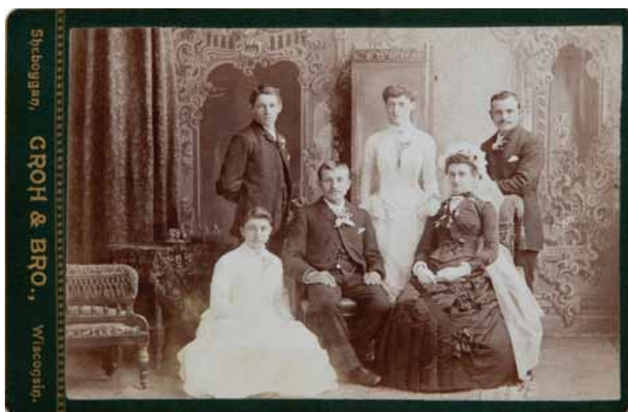
Kabinetkaart van een huwelijksfoto 1870-1880, Groh & Bro, Photographic Studio, Wisconsin.