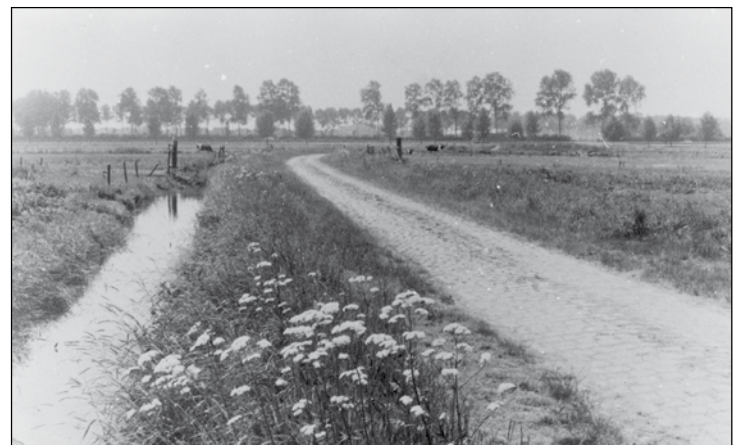
Een foto uit 1976 van de Berkdijk in de Willemspolder op Oosteind Bij de ruilverkaveling van de Willemspolder is deze weg verdwenen

Bij het gebied de Vijftig Bunder lag de Nieuwe Dijk , die al in 1681 vermeld wordt als 'den Nieuwen Dyck' (ND12391, f19). De Rietdijk in de Polder werd in 1623 aangeduid als den Riedijk (R295, f178v), een dijk waartegen riet groeide. De Vijftigbunderdijk verschijnt in het jaar 1435 als Vijftich Buenderdyc (P1255, f78v). Hij lag uiteraard bij het gebied de Vijftig Bunder en was identiek met de Effentweg. De Visserdijk wordt al in 1430 genoemd als Vischuysdijk (ND11870, f9), dus de dijk bij het Vishuis. Dat was een huisje in de polder waar vis die in de ondergelopen gebieden van de polder (na de Elisabethsvloed van 1421) gevangen werd, verkocht werd. Tegenwoordig een weggetje, fietspad van zuid naar noord, net ten noorden van het Kasteel van Strijen ofwel de restanten ervan, de Slotbossche Toren. De Zanddijk in de Polder was ook een weg ten noorden van het Kasteel van Strijen, een deel van de Effentweg. In 1878 was hij 330 meter lang en 9 meter breed. Oudste vermelding: 1379 aenden Santdyc 14 . Blijkbaar was het een dijk aangelegd