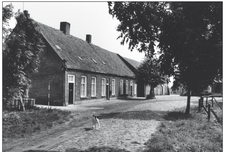
Boerderij aan de Groenendijk 40-44.

De ordonnantie van 1699 was waarschijnlijk een herhaling van een oudere bepaling. Een dijk zoals hier ontworpen werd, was bijvoorbeeld de Eikdijk, de verbinding van Oosterhout met het zuidelijk ervan gelegen kerkdorp Dorst. Over de Eikdijk stroomde in de 17e eeuw het water van het gebied ten oosten ervan naar het westen, richting Vuchtpolder en Mark. De dijk was hierdoor in de winter vrijwel onbegaanbaar, waardoor de overledenen uit Dorst niet naar het kerkhof konden worden gebracht. Dit type dijken kon volgens een vrij recht tracé worden aangelegd, omdat ze door onontgonnen heidevlakten liepen. De aanleg van dijken langs de rivieren en rondom polders, de 'echte' alluviale dijken dus, begon in Oosterhout misschien in de 12e, 13e eeuw. Veel relatief kleine gebieden kregen een aparte omdijking, bijvoorbeeld de Vijftig Bunder. Deze alluviale dijken waren meestal allesbehalve recht, omdat een rivier bochtig was