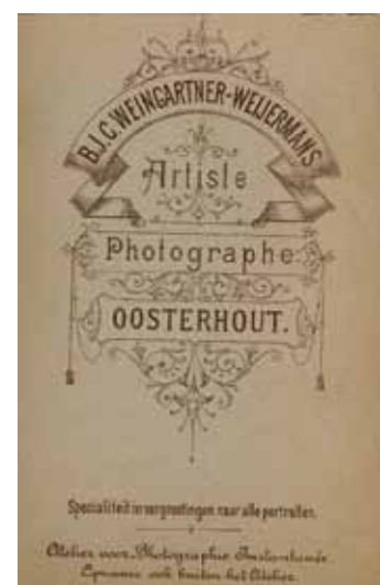
Op de foto's stonden geen naam vermeld en daarom weten we niet wie deze persoon is. Uit de achterkanten blijkt dat Barend fotografeerde. Cartes de visite collectie J. Broekhoven.