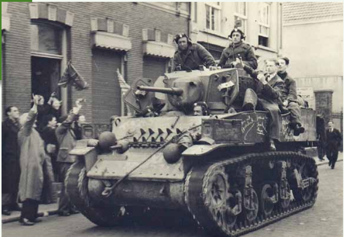
Op 30 oktober 1944 trokken de geallieerden Oosterhout binnen

PERIODIEK VAN HEEMKUNDEKRING DE HEERLIJKHEID OOSTERHOUT