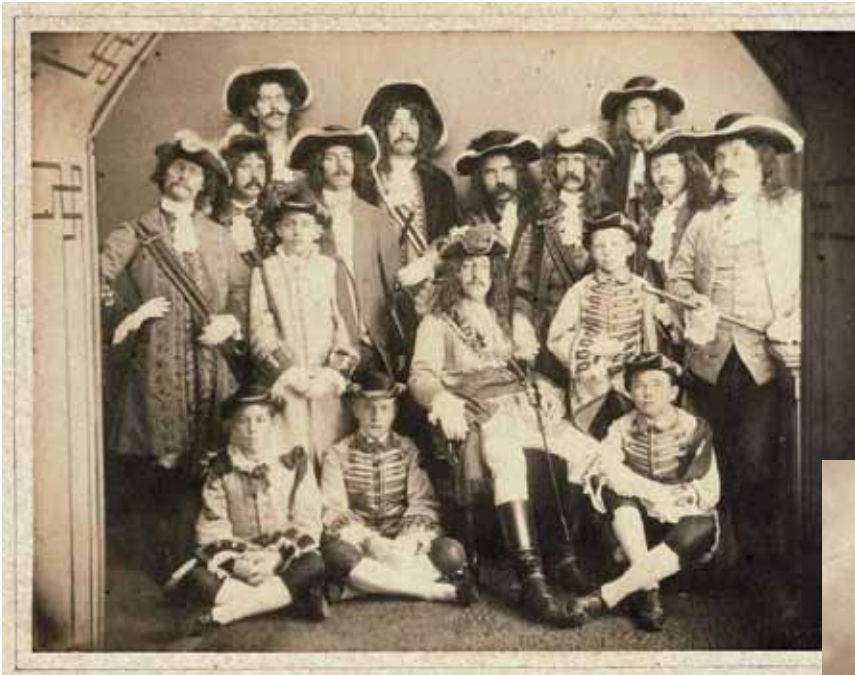
Foto, gemaakt op 7 september 1890 door Barend Weingärtner, van handboogschuttersgilde Sint Sebastiaan, dat zijn 140-jarige jubileum vierde. Archief Tilburg, foto nr. 103576.