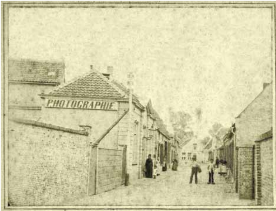
Circa 1885, Grote Braak, gezien vanaf de Heuvel in Oosterhout. In het pand links de fotostudio van de Oosterhoutse fotograaf B.J.C. Weingärtner. Het pand deed tevens dienst als tekenschool, waar de voornoemde Weingärtner les gaf. Foto uit 't Toekomstig Verleden'