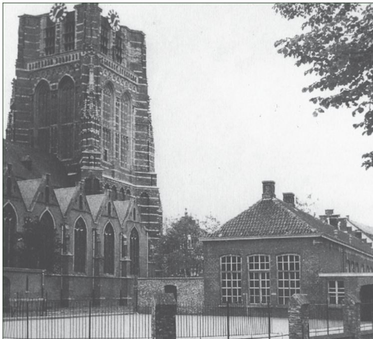
School in de Torenstraat waar de afdeling bouwkunde gerealiseerd werd.

ter, in 1919, zou uit de tekenschool de ambachtsschool aan de Heuvel in Oosterhout ontstaan. In 1920 werd de tekenschool opgeheven.