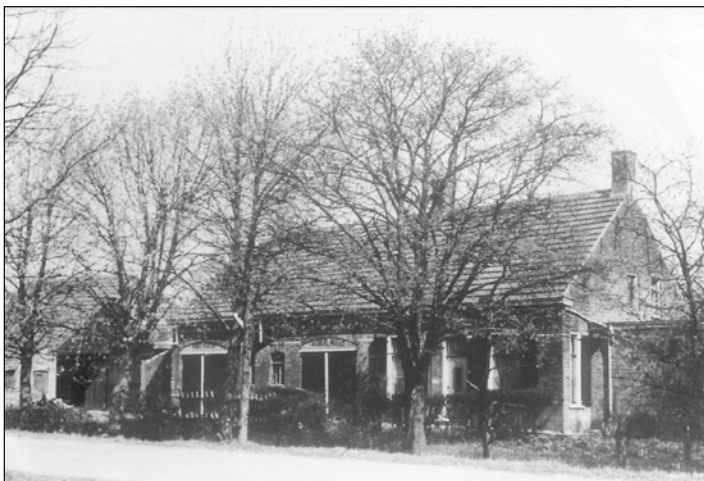
De Eikdijk met de boerderij 'Rust roest, Arbeid adelt' van Louis Huijben. De boerderij is in 1969 gesloopt.

Hieronder volgen eerst de dijken van Oosterhout en de Polder, daarna van de kerkdorpen.