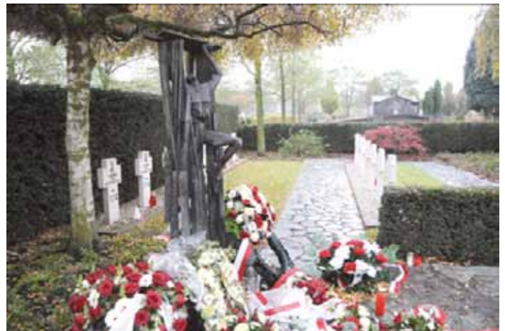
Het bronzen beeld midden-links omgeven met bloemen.

De jaarlijkse herdenking van de bevrijding van Oosterhout in 1944 had in 2012 wel een heel spe-