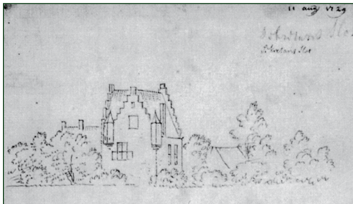
Het slotje Van Aalst of Bersselaar was een van de vele slotjes die Oosterhout rijk was. Het wordt al in 1435 aangeduid als een gesate. Tekening uit 1729 door C. Pronk in zijn schetsboek. Collectie Rijksprentenkabinet.

Dit slotje heette ook wel Van Aalst en werd door Juten ten onrechte gesitueerd in de buurtschap Ter Aalst, terwijl het aan de huidige Van Duivenvoordestraat stond. Hier moet dus de oude schuilkerk gezocht worden. Juten schrijft verder: "Een adres van den protestanschen kerkeraad in 1698 zegt dat deze kerk, reeds veertig jaren door de katholieken in gebruik, stond 'aen een hoek, waar echter weinig passage is en wat ter zyden van den grooten weg en echter bijna in het midden van dit dorp', terwijl, volgens de katholieken, de weg naar de kerk bij slecht weer onbegaanbaar was." "In de loop der jaren is de kerk te klein geworden, zoodat men genoodzaakt was een andere kapel te openen in de Ridderstraat, waar gewoonlijk de kapelaan dienst deed." Door de katholieken werden verzoeken ingediend om elders een nieuwe kerk te mogen bouwen. De protestantse kerkenraad op haar beurt probeerde dit plan tegen te houden. "Ten slotte werd 30 december (1707) door den Raad des Konings beslist, dat de katholieken in Oosterhout een nieuwe kerk in hout mochten optrekken. In 1710 kon een kerk-schuur, welke in de Kruisstraat (lees: Rulstraat - FvW) was gebouwd, voor godsdienstoefeningen in gebruik worden genomen. In 1712 schreef deken Verhaeren in zijn verslag dat er reeds twee altaren geplaatst waren en dat een derde weldra gereed zou wezen."