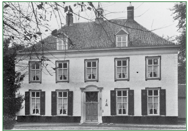
Het slotje Beveren, dat na 1450 waarschijnlijk als boerderij gebouwd werd, onderging in 1740 of 1779 een verbouwing, waarbij het huis met een verdieping verhoogd en tevens verbreed werd. Tot 1859 functioneerde het als pastorie van de St. Jansparochie. Hierna werd het bewoond door enige brouwers, die enkele verfraaiingen in het interieur aanbrachten. In 1974-1976 werd het slotje gerestaureerd. De fraaie ingangspartij is in Lodewijk XV-stijl.