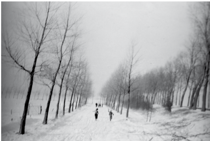
De Effentweg (bij de Veerseweg, rechts) in de sneeuw. Deze weg werd vroeger waarschijnlijk ook Effentdijk genoemd.

straten 8 . Aan de oostzijde van de Mark, onder Ulvenhout en Strijbeek was ook een Rechte Straat bekend, evenals te Turnhout (1550), Minderhout (1467) en Hoogstraten (1455) 9 . Ook in Riel wordt in 1613 een Rechtestrate genoemd (Breda820, f70v). In Poppel wordt in 1742 een Rechten dyck genoemd 10 . Recht heeft waarschijnlijk dus geen betrekking op het tracé van de weg maar op het van rechtswege verplichte karakter om deze weg te volgen (ter voorkoming van tolontduiking). In de keuren van Turnhout (1550) wordt bepaald dat de schapen niet door een akkerstraat gestouwd mochten worden, maar door 'die gerechtighe heerstraat' 11 . Een Rechtestraat zou gelijk staan met de Heerstraat, de belangrijkste doorgaande weg 12 (een Heerstraat is geen 's Herenstraat). De Rechtendijk was in elk geval allesbehalve recht; hij liep duidelijk krom (zie bijvoorbeeld de kaart van Ketelaar). Leenders vermoedt dat hij in oorsprong