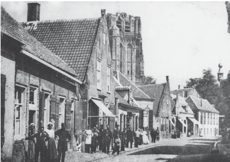
Foto van de Kerkstraat, gemaakt op 01-07-1865.