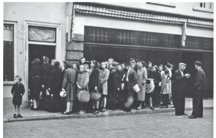
In de rij voor voedsel.

De voedselsituatie verslechtert met het naderen van de geallieerde bevrijdingslegers. In Oosterhout zijn fruit en tomaten in augustus 1944 niet meer te koop.