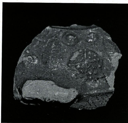
Strijen: resten van een vermoedelijk vijftiende-eeuwse kacheloven uit de archeologische collectie

In 2012 en 2013 9 vonden in de directe omgeving van het kasteelterrein nog enkele relevante archeologische onderzoeken plaats. Uitge-