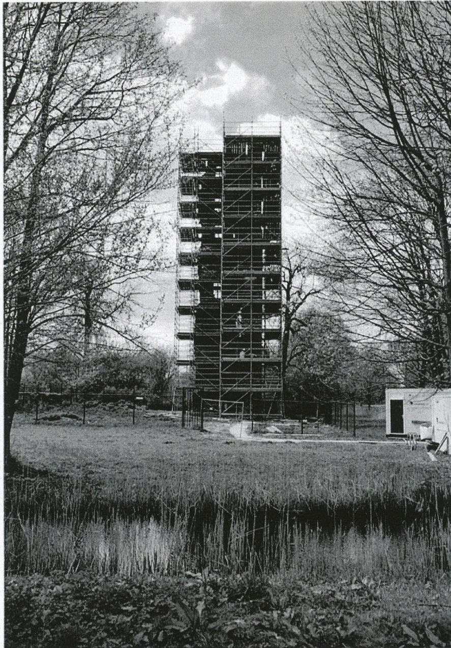
De kasteelruïne van Strijen aan de Kasteeldreef te Oosterhout. Van begin tot en met juni 2015 zou de toren een fikse opknopbeurt krijgen