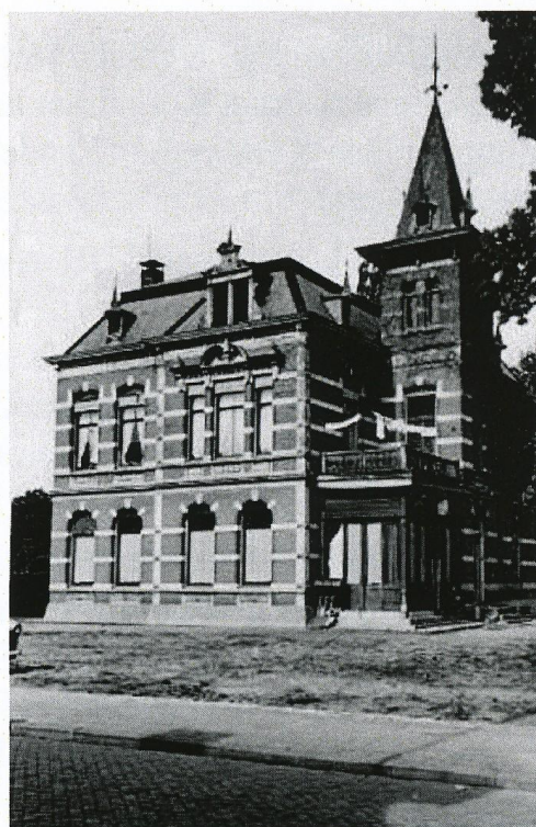
Keiweg. Villa Mathilda, hier staat nu de Albert Hein

Deze straatnaam komt in 1435 voor als Kercstrate.