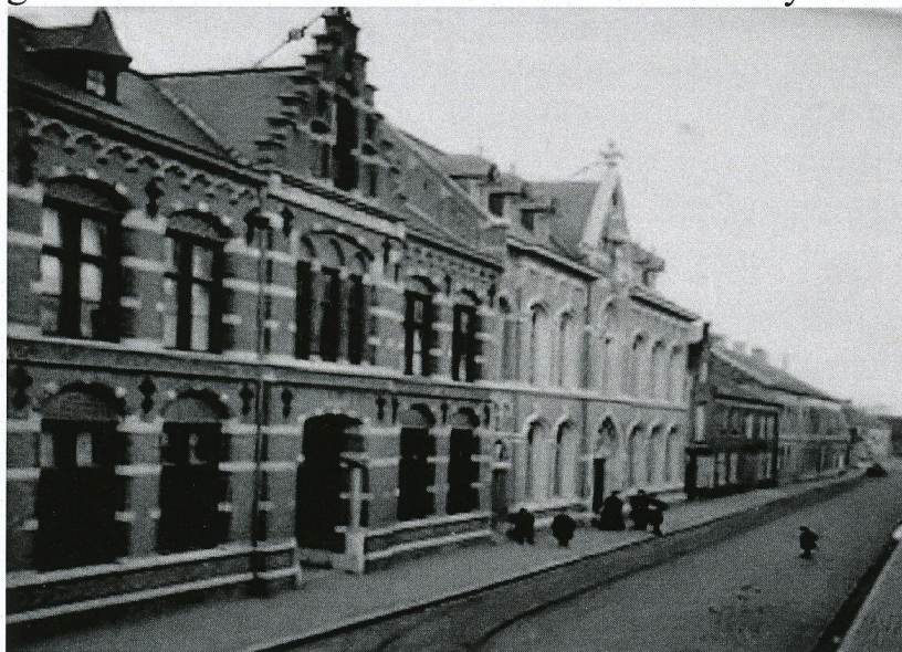
De Arendstraat in oostelijke richting; links op de voorgrond het broederhuis met school, daarnaast het weeshuis later patronaat; op de plaats van het patronaat staan nu 3 winkels

aangeduid als een 'sheren straet', een straat van de heer. De kleinste straatjes waren niet van de heer maar van de aangrenzende landbezitters. De Arendstraat dankte zijn naam aan de herberg 'de Arent, die in 1681 al genoemd wordt en toen in bezit was van Dionysius van Loon.