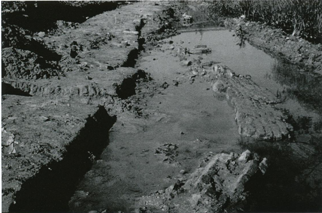
Strijen: anders dan in 1974 bleven de gevonden resten in 1985 beperkt tot delen van de zuidelijke kademuur die in de gracht waren gevallen.

(RAT). Het voormalige gemeentearchief Oosterhout was namelijk ondertussen opgeheven en ondergebracht in het RAT.