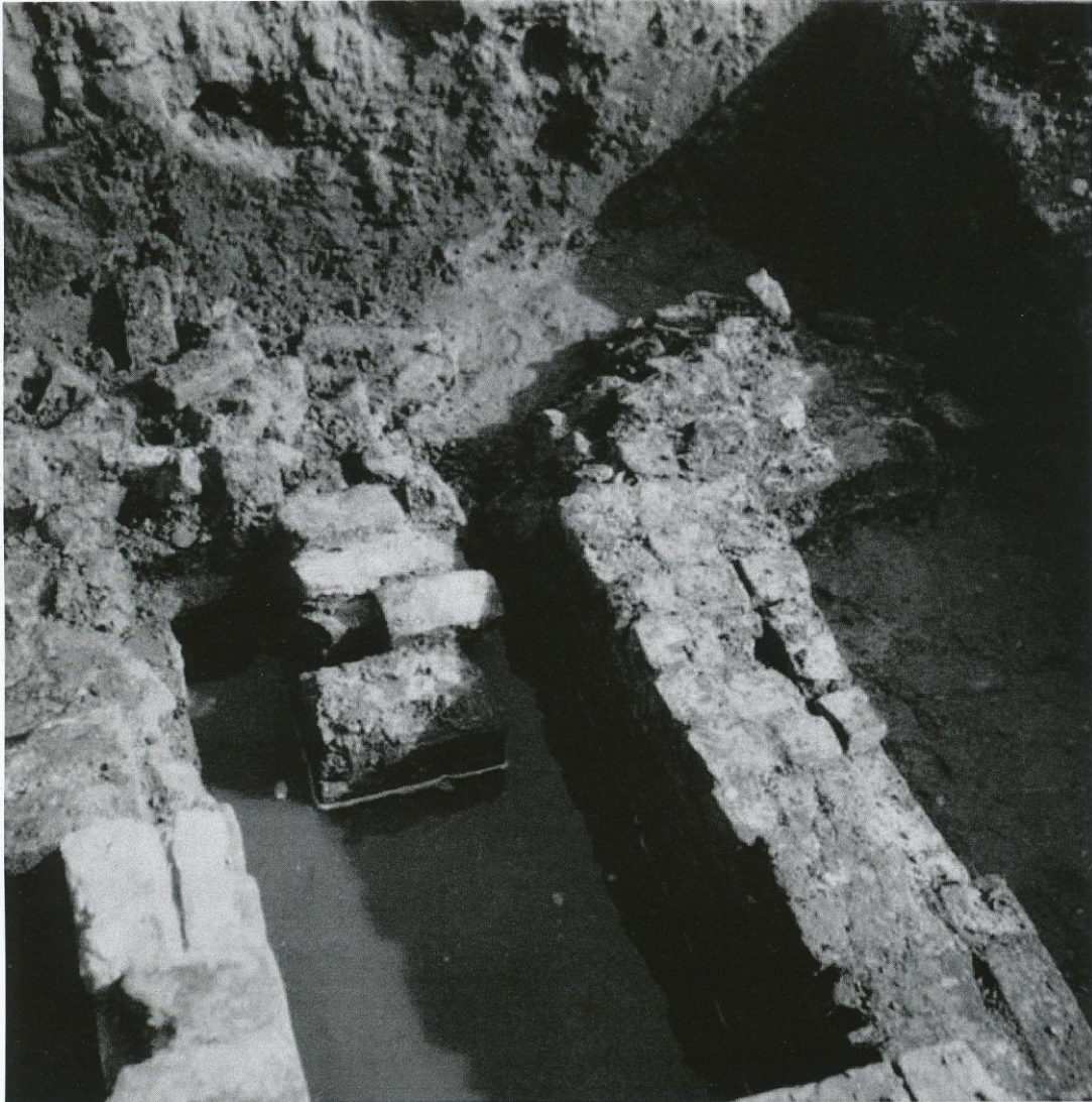
Het opgegraven privaat van het 'voorburchtterrein' van de Hofstede aan de Brandweg

stenen gebouw, werden diverse aardewerkfragmenten geborgen en werden de resten van een mogelijk voorburchtterrein aangesneden.