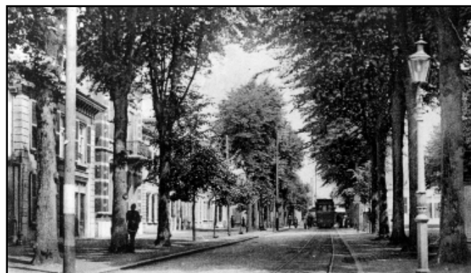
De Heuvel met de stoomtram die op het punt staat linksaf te slaan.

RONDON DE HERINRICHTING van de Heuvel zijn diverse activiteiten gepland. In de gang van Arendshof 2 is in de maand oktober een expositie over de Heuvel te zien. Loop je van de ene kant de tentoonstelling tegemoet, dan kom je van alles te weten over de rijke historie van de Heuvel. Kom je van de andere kant, dan leer je meer over de ambachtelijke details die verwerkt zitten in de architectuur en het plein zelf. Later staan er nog een boek en een film over de Heuvel op stapel; die worden volgend jaar zomer verwacht. Daarnaast komt er nog een oproep via het platform doemee.oosterhout.nl om alle inwoners uit te nodigen hun verhaal over de Heuvel te delen. Samen vormen we zo het geheugen van Oosterhout!