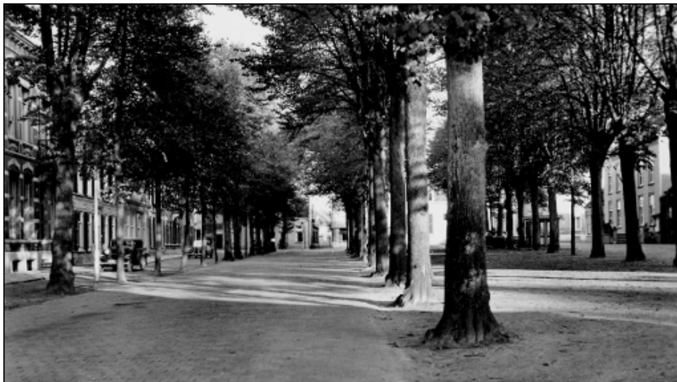
Een 'recentere' prentbriefkaart van de Heuvel: de rails zijn verdwenen, de stoomtram rijdt niet meer. Aan de auto's te zien dateert de foto van laat in de eerste helft van de twintigste eeuw.

https://izi.travel/nl/4e29-herbeleef-de-heuvel/nl