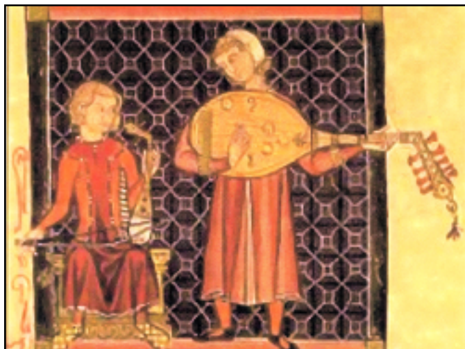
Een troubadour luisterde veel feesten in vroegere eeuwen op.

voorzitter van de sociëteit schrijft in de notulen dat hij dit als een grote dag beschouwt. De op de Grebbeberg gesneuvelde Nederlandse militairen zijn op dat moment nog niet eens allemaal begraven. Gelukkig komt er aan deze naar collaboratie riekende toestand een einde. Dat ligt echter niet aan het bestuur. De Duitse militairen die hier gelegerd zijn, worden in oktober 1940 vervangen door een andere militair onderdeel, waarvan de officieren niet meer dan fl 1,20 per dag willen betalen in plaats van de fl 2,00 die hun voorgangers betaalden. Dat is nog juist op tijd, anders had het bestuur misschien ook nog de oktoberfeesten voor de Duitsers, de nieuwe vrienden van de sociëteit, georganiseerd. Nu hebben we er meer dan zestig jaar op moeten wachten, voordat de directie van hotel Het Zonneke aan de Zandheuvel deze feesten voor alle Oosterhouters organiseerde.