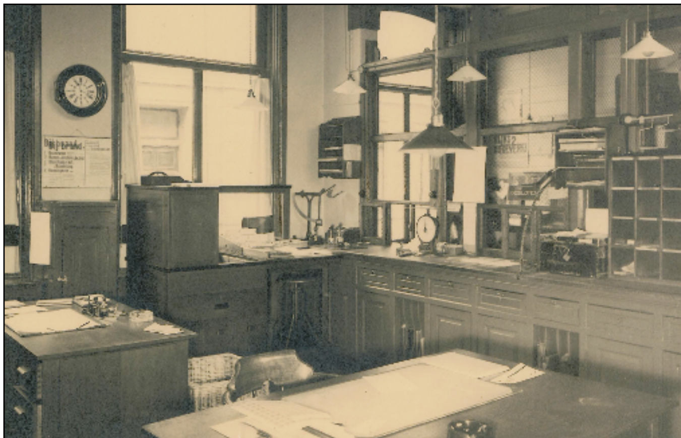
Interieur van het postkantoor aan de Arendstraat.