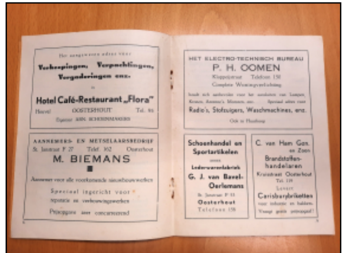
Advertentiepagina uit de eerste folder van Biemans Makelaardij.