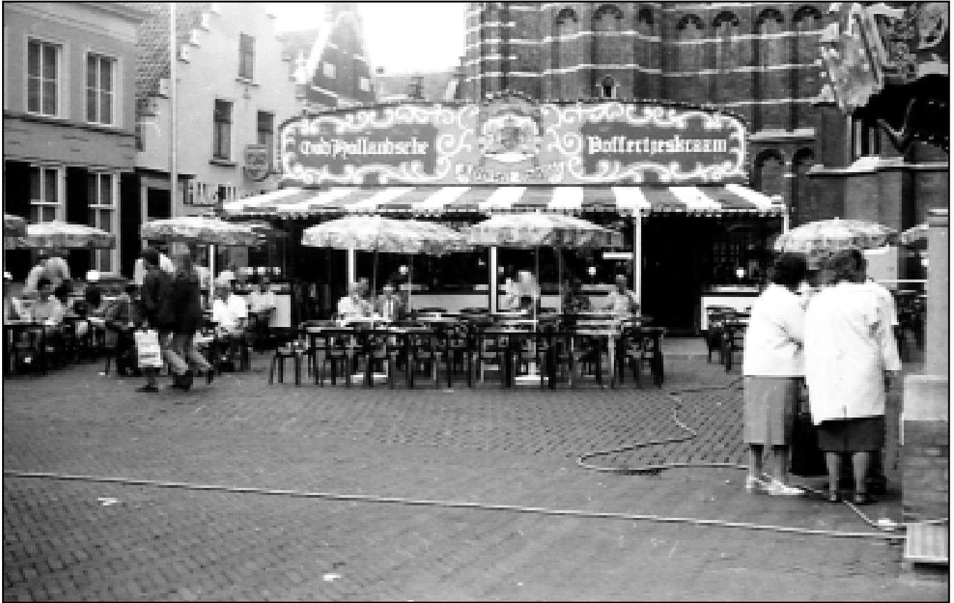
De Oosterhoutse kermis in 1992.