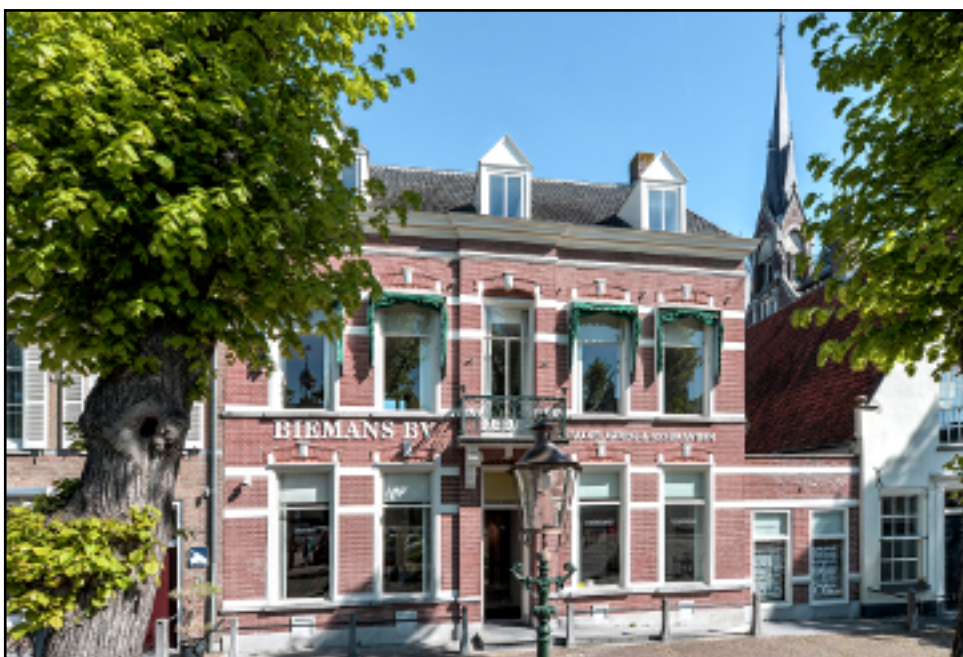
Het fraaie pand van Biemans BV aan de Heuvel 4.