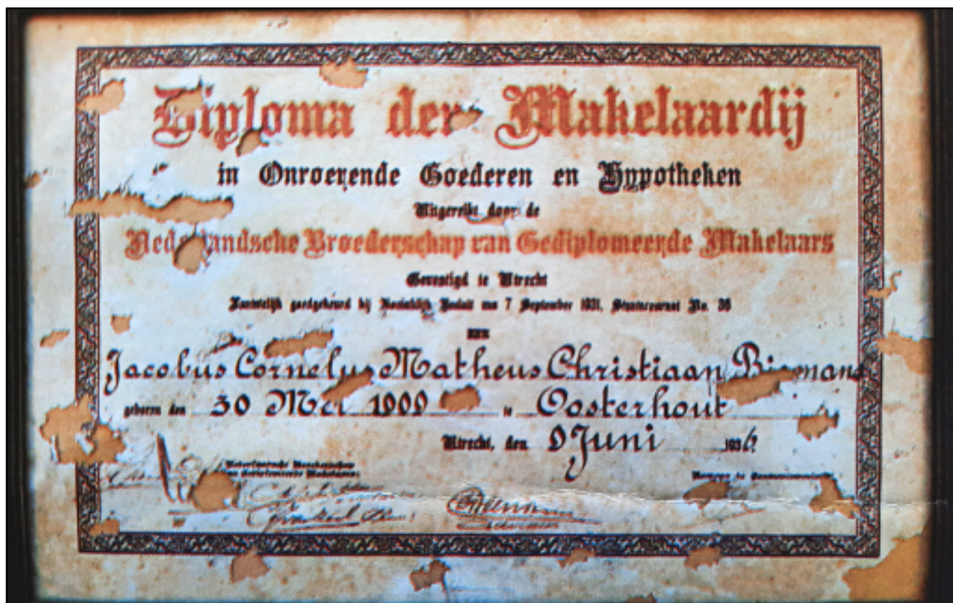
Het makelaardijdiploma van Jacobus Biemans. Niet aangevreten door de muizen, zoals je misschien zou denken, maar beschadigd geraakt bij een bombardement in de Tweede Wereldoorlog.