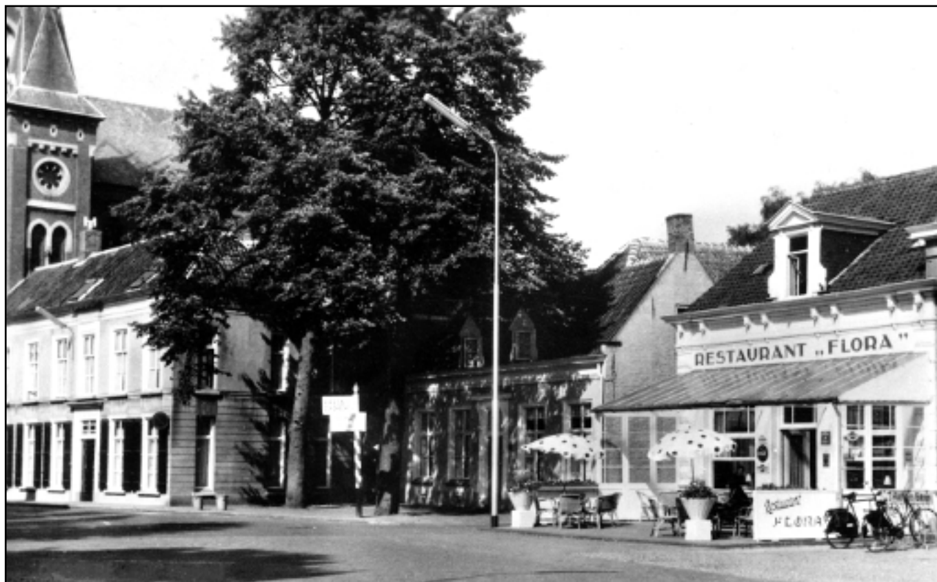
Een Ansichtkaart van café-restaurant Flora van ergens halverwege de twintigste eeuw.