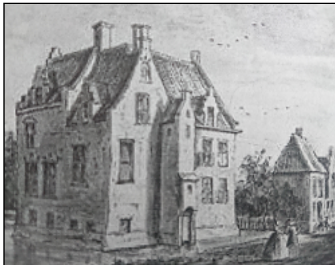
Een oude tekening van Slotje Brakestein. Het uitstulpsel aan de buitenmuur is 'het gemak', ofwel het toilet.

We lopen door naar het park dat ooit de privé-tuin van Slotje Brakestein was.