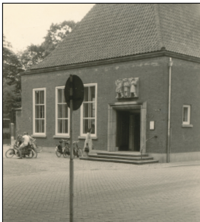
Heuvel 27 in 1962. Vanaf 1955 was er het postkantoor gevestigd.

Toen werden er zeven departementen ingesteld,