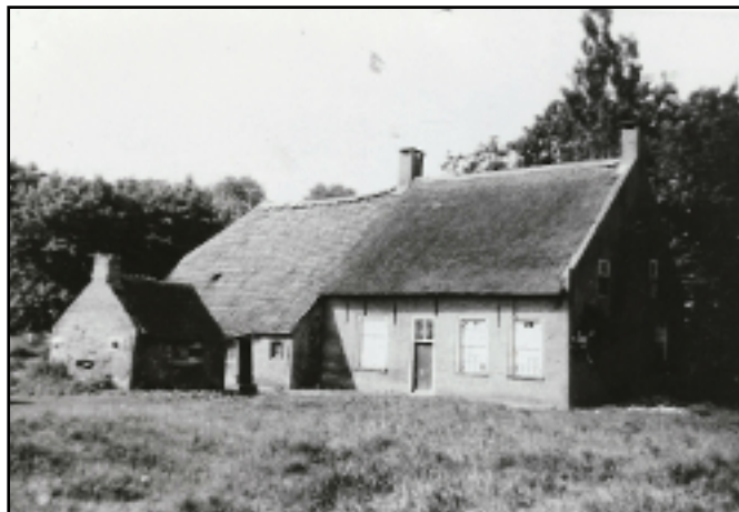
Voormalige boerderij aan Oude Heikantsestraat 8 (nu Monnikendreef?) met vrijstaand bakhuis.

In de late middeleeuwen kwam in Oosterhout mogelijk een ander type dan de in de 20e eeuw overal aanwezige Vlaamse Schuur voor: het dwarsdeeltype, waarbij de grote deuren in de lange gevels zaten; men reed dus dwars door de schuur 42 . Dit in tegenstelling tot de langsdeelschuur, waarbij de kar met graan over de dorsvloer, die in de lengte van de schuur ligt, rijdt. Van die dwarsdeelschuren zijn er bijna geen meer over. Op Luchtenburg onder Ulvenhout staat er nog een. Een afbeelding ervan staat in 'De Dynamische Hoeve' 43 . Na de Tachtigjarige Oorlog zou men in de Baronie op de Vlaamse schuur zijn overgestapt. Maar wat voor schuur er dan van tevoren was, is niet duidelijk. Waren het allemaal schuren van het dwarsdeeltype